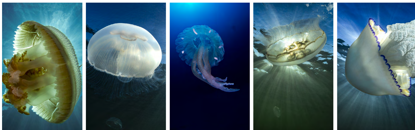
Lauréat catégorie Portfolio 2024

En participant à ce concours, le photographe s'engage à faire preuve d'un comportement respectueux envers les espèces photographiées. Seront refusées les photos mettant en scène la faune et la flore domestique ou découlant d'une intervention humaine : captivité, dérangement (prises au nid...)