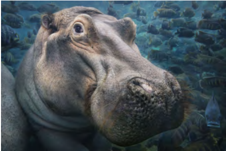
ENDANGERED Hippopotamus The hippopotamus is a large, herbivorous mammal that is native to sub-Saharan Africa. It is considered endangered because of habitat loss and poaching for its ivory.