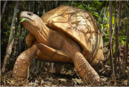
ENDANGERED Tortoise The tortoise is a type of reptile that is found in many parts of the world. It is considered endangered because of habitat loss and the illegal pet trade.