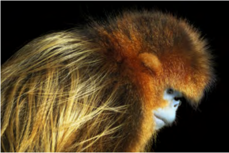
ENDANGERED Golden Snub-nosed Monkey The golden snub-nosed monkey is a species of monkey that is native to China. It is considered endangered because of habitat loss and the illegal pet trade.