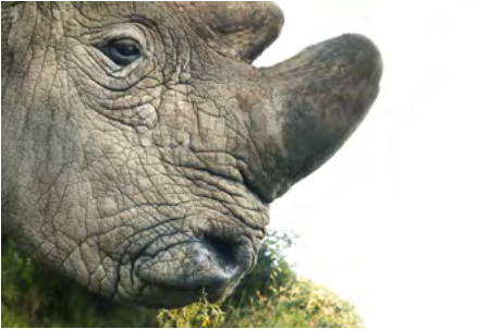
ENDANGERED Rhinoceros The rhinoceros is a large, herbivorous mammal that is native to sub-Saharan Africa. It is considered endangered because of habitat loss and poaching for its horn.