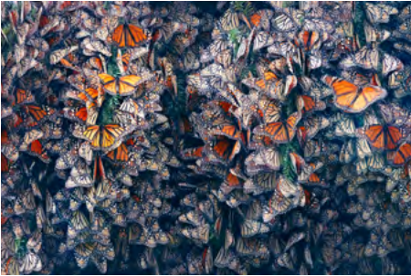
ENDANGERED Monarch Butterfly The monarch butterfly is a species of butterfly that is found in many parts of the world. It is considered endangered because of habitat loss and the illegal pet trade.