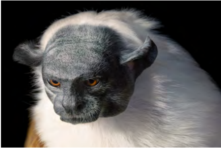
ENDANGERED Lemur The lemur is a type of primate that is native to Madagascar. It is considered endangered because of habitat loss and the illegal pet trade.