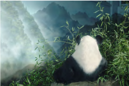
ENDANGERED Giant Panda The giant panda is a large bear that is native to China. It is considered endangered because of habitat loss and the illegal pet trade.