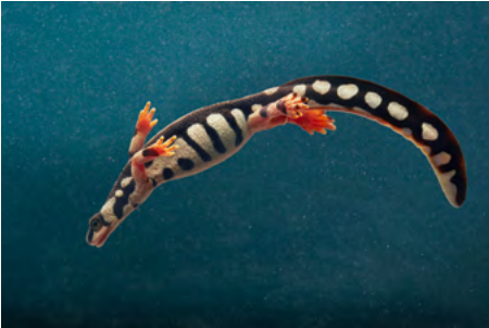
ENDANGERED Hellgramite The hellgramite is a type of millipede that is found in many parts of the world. It is considered endangered because of habitat loss and the illegal pet trade.