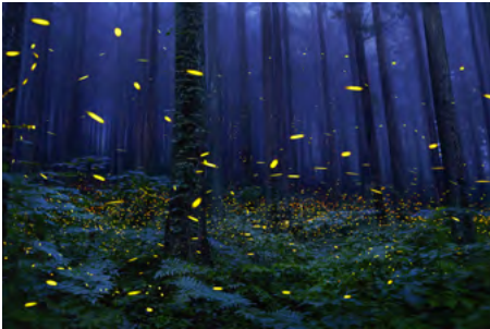
ENDANGERED Firefly The firefly is a small, bioluminescent insect that is found in many parts of the world. It is considered endangered because of habitat loss and the use of pesticides.